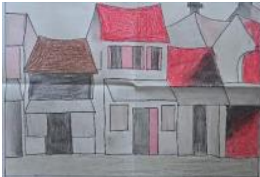
Tranh của HS