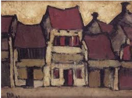
Tranh của họa sĩ Bùi Xuân Phái